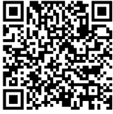
รายการการโอนงบบุคลากร