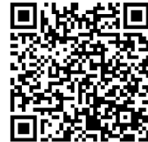
คู่มือการโปรแกรม