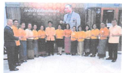
ชุดผ้าไทย