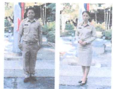
ชุดเครื่องแบบข้าราชการ

ตัวอย่างการแต่งกายของผู้เข้ารับการฝึกอบรม