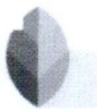
Snapseed Google LLC