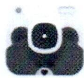
LINE Camera LINE Corporation