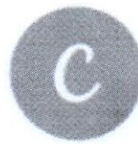
Canva เครื่องมือ Canva