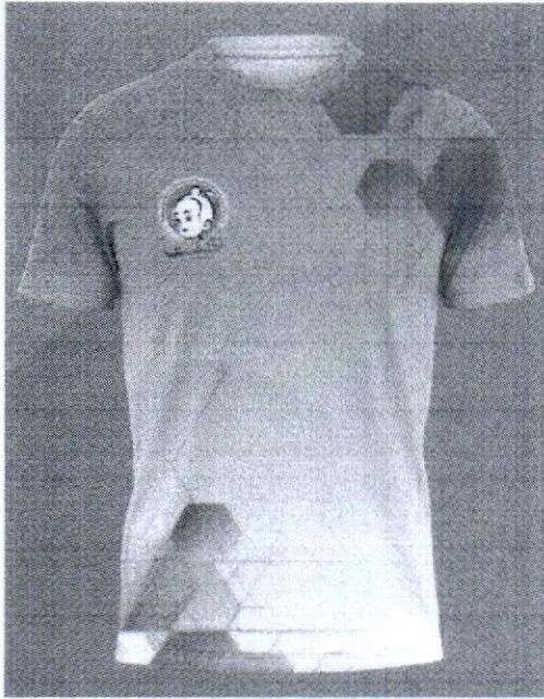
เสื้อ ราคา 220 บาท