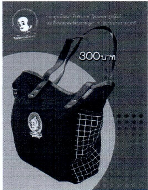
กระเป๋า ราคา 300 บาท