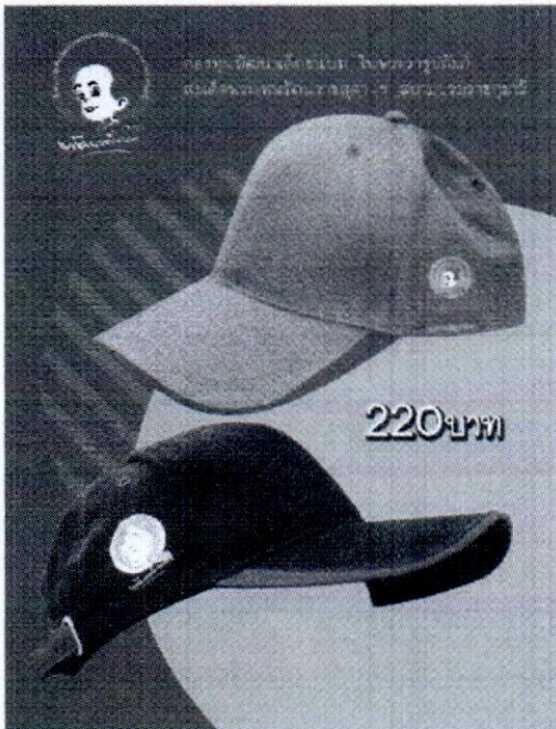
หมวก ราคา 220 บาท