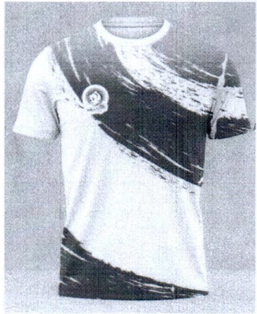
เสื้อ ราคา 220 บาท