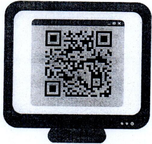
Poster ประชาสัมพันธ์