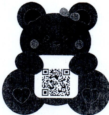
Facebook นวัตกรรม