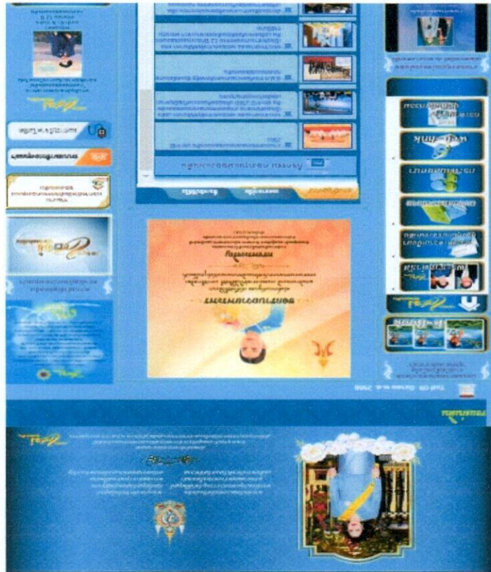
1. ศึกษารายงานผลการดำเนินงานที่ https://www.kongtunmae-oncb.go.th/