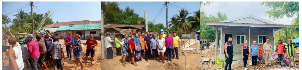
สภาพที่อยู่อาศัย ก่อนได้รับการช่วยเหลือ