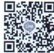
รุ่นที่ ๒