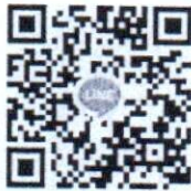
รุ่นที่ ๑

๒. ให้ผู้เข้าร่วมกิจกรรมการพัฒนาประสิทธิภาพการประเมินบุคคลเพื่อเลื่อนขึ้นแต่งตั้งให้ดำรงตำแหน่งที่สูงขึ้น ประเภทวิชาการ ระดับชำนาญการ และประเภททั่วไป ระดับชำนาญงาน เข้าร่วมกลุ่มไลน์ดังนี้