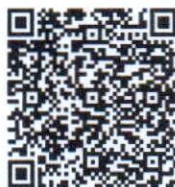
QR Code ครัวเรือน TPMAP แยกรายมิติ

ครัวเรือนยากจนเป้าหมาย TPMAP ที่ตกเกณฑ์มิติด้านมาตรฐานความเป็นอยู่ครัวเรือนที่ตกเกณฑ์ตัวชี้วัด เป้าหมายในการให้ความช่วยเหลือ ๒๗ ครัวเรือน