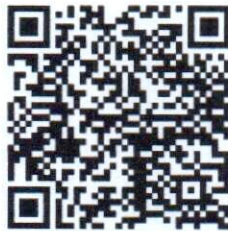
ผลการรายงานการเพิ่มสมาชิก รายอำเภอ