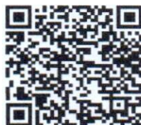
QR Code ครัวเรือน TPMAP

ครัวเรือนยากจนเป้าหมาย TPMAP ที่ตกเกณฑ์มิติด้านมาตรฐานความเป็นอยู่ครัวเรือนที่ตกเกณฑ์ตัวชี้วัด เป้าหมายในการให้ความช่วยเหลือ ๒๗ ครัวเรือน